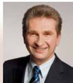
Andreas Pinkwart, FDP-Landesvorsitzender NRW und stellv. FDP-Bundesvorsitzender

Bereits nach wenigen Wochen zeigt die rot-grüne Minderheitsregierung ihr wahres Gesicht: Die vorgebliche Koalition der Einladung hat sich längst als eine ausschließlich an der Durchsetzung ihrer Parteiinteressen ausgerichtete Regierung entzaubert, die in allen schwierigen Situationen auf die Linken als Hilfsmotor zählen kann. Für die FDP ist klar: Wir arbeiten als ebenso kritische wie auch konstruktive Opposition im Sinne des Landes. Wir werden nichts unversucht lassen, um die Menschen vor falschen Weichenstellungen bei Schule, Hochschule und Infrastruktur zu bewahren, ohne uns dabei selbst zu verbiegen. Dies setzt eine harte und engagierte Arbeit im engen Zusammenwirken von Partei, Fraktion und der kommunalen Ebene voraus. Wir zeigen in den wichtigen Zukunftsfeldern gangbare Pfade der Vernunft