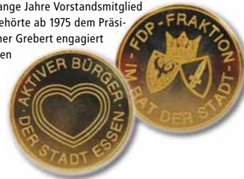
Aus echtem Gold – der Essener Bürgertaler