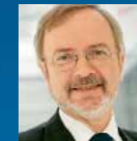
Werner Hoyer FDP-Bundestagsabgeordneter

Der langjährige FDP-Bundestagsabgeordnete, Werner Hoyer, wird Präsident der Europäischen Investitionsbank (EIB). Hoyer, der seit 1987 dem Deutschen Bundestag angehört, übernimmt Anfang 2012 die Leitung des europäischen Geldinstituts. Die EIB fördert die Ziele der Europäischen Union durch die langfristige Finanzierung tragfähiger Investitionen. Zwar, so Hoyer, der seit 2009 auch Staatsminister im Auswärtigen Amt ist, falle es ihm schwer, das Bundestagsmandat aufzugeben, da er die Aufgabe als Volksvertreter jederzeit sehr ernst genommen habe. Er betont jedoch die entscheidende Rolle, die die EIB bei der europäischen Integration innehat: „Wir müssen die Europäische Union und die gemeinsame Währung sicher machen. Durch die EIB können wir viele Projekte finanzieren, die für die Verbesserung der Wettbewerbsfähigkeit Europas in der Globalisierung von herausragender Bedeutung sind.“ Der FDP-Landesvorsitzende, Daniel Bahr, beglückwünscht Hoyer, zu dessen Wechsel an die Spitze der EIB: „Das Ausscheiden Werner Hoyers hinterlässt eine große Lücke im Deutschen Bundestag. Seine Expertise in volkswirtschaftlichen und europapolitischen Fragen ist über Fraktionsgrenzen hinweg anerkannt. Aber gerade das eignet ihn hervorragend für seine neue Aufgabe. Ich gratuliere Werner Hoyer im Namen aller Mitglieder der FDP-NRW und wünsche ihm für seine neue Herausforderung alles Gute.“