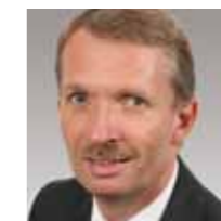
Gerhard Papke, Vorsitzender der FDP-Fraktion im Landtag Nordrhein-Westfalen

Die Schuldenbremse des Grundgesetzes fordere bis spätestens 2020 einen ausgeglichenen Haushalt, der nur durch einen langfristigen Konsolidierungspfad erreicht werden könne, mahnte Papke in der Debatte an. „Der rot-grüne Haushaltsentwurf 2012 bewegt sich aber nicht auf einem solchen Konsolidierungspfad, sondern führt unser Land immer tiefer in die Verschuldungsfalle.“ Das sei mit dem Gebot der Generationengerechtigkeit nicht vereinbar.