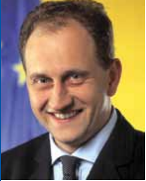
Alexander Graf Lambsdorff neuer Vize-Präsident der ELDR, Vorsitzender der FDP-Delegation im Europäischen Parlament