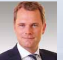
Daniel Bahr, Landesvorsitzender der FDP-NRW