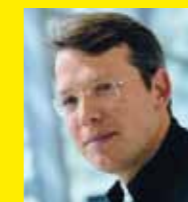
Otto Fricke, Parlamentarischer Geschäftsführer sowie haushaltspolitischer Sprecher der FDP-Bundestagsfraktion:

Die aktuellsten Meldungen der FDP-Bundestagsfraktion finden Sie im Internet unter: www.fdp-fraktion.de