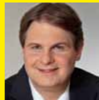
Ralf Witzel, Parlamentarische Geschäftsführer, Sprecher für Medienpolitik der FDP-Fraktion im Landtag Nordrhein-Westfalen

Nach dem Gesetzentwurf der FDP sollen die Kompetenzen des WDR-Datenschutzbeauftragten künftig allein auf die WDR-internen, journalistisch-redaktionellen wie administrativen Belange beschränkt werden. „Der WDR-Datenschutzbeauftragte ist und bleibt für die innerbetrieblichen Belange zuständig“, erklärt Witzel. Die Arbeitsweise der GEZ unter datenschutzrechtlichen Gesichtspunkten sollte aber künftig der unabhängige Landesdatenschutzbeauftragte übernehmen. „Durch diese neutrale Kontrolle kann der Schutz der sensiblen Datenmenge von rund 42 Millionen Bürgern optimal gewährleistet werden.“