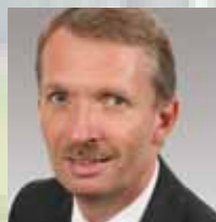
Gerhard Papke, Vorsitzender der FDP-Fraktion im Landtag Nordrhein-Westfalen