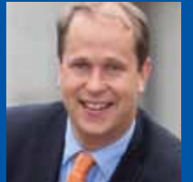
Joachim Stamp, Generalsekretär der FDP-NRW

auszubauen und ihnen die Koordinierung sämtlicher Integrationsarbeit in den Kommunen zu übertragen, schießt jedoch über das Ziel hinaus. Dies mag für Kommunen mit bisher wenig Integrationsarbeit hilfreich sein. Für andere Kommunen, die über eigene Integrationsbeauftragte, -konzepte und -referate verfügen, besteht hier jedoch die Gefahr von Parallelstrukturen. Die FDP will daher erreichen, dass die Kommunen viel weitgehender in die Entscheidungsarbeit einbezogen werden, wie die Integrationsarbeit vor Ort koordiniert wird. Denn gerade vor Ort entscheidet sich, ob Integration gelingt.