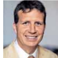
Stefan Romberg, Sprecher für Arbeit, Gesundheit und Soziales der FDP-Fraktion im Landtag Nordrhein-Westfalen

Auf Initiative der FDP-Landtagsfraktion sind die Bürgerrechte von Psychiatrie-Patienten in den NRW-Kliniken erheblich gestärkt worden. Der Landtag stimmte mit großer Mehrheit dem Gesetzentwurf der FDP zu. Danach ist in Nordrhein-Westfalen die Videoüberwachung von zwangsweise untergebrachten Psychiatrie-Patienten verboten.