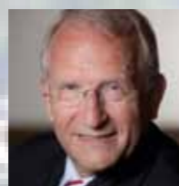
Horst Engel, Sprecher für Kommunalpolitik der FDP-Fraktion im Landtag Nordrhein-Westfalen