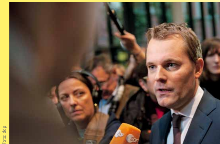
Daniel Bahr, Landesvorsitzender der FDP-NRW zum Mitgliederentscheid